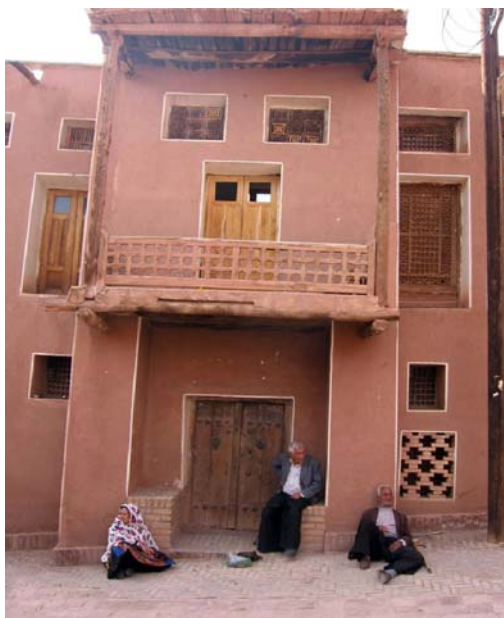
تصویر ۳: نمایی از جداره بهسازی شده