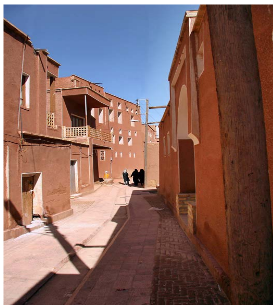
تصویر ۲: نمایی از معبر بهسازی شده

آن به بخش قدیمی و باارزش کالبد روستا و نبود جمعیت در تمامی گستره بافت دانست. توجه یک بعدی به بافت‌های باارزش روستایی نه تنها به عمیق‌تر شدن شکاف میان بافت باارزش و بافت جدید روستا خواهد انجامید، بلکه این‌گونه نگرش تجریدی نوعی دوگانگی و تبعیض را در اذهان تداعی می‌سازد و