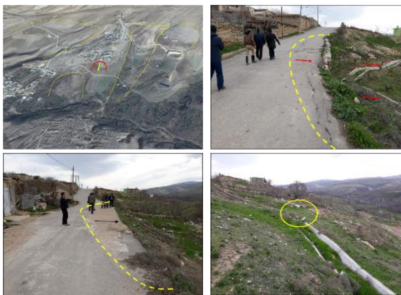
شکل ۱۷. الف: نمایی از زمین لغزش‌های قدیمی در اطراف سایت جدید روستای عرب، ب: گسترش ترک‌های کششی حاصل از لغزش در جسم جاده و جابه‌جایی عمودی و افقی در کانال آبیاری، پ: ترمیم محدوده لغزشی بعد از رخداد، ت: تخریب کامل بخشی از کانال آبیاری بر اثر زمین لغزش (محدوده زرد رنگ)، برگرفته از مطالعات پایدارسازی روستای عرب

بر اساس بازدید میدانی از سایت جدید روستای عرب، یک محدوده لغزشی در حاشیه جنوبی روستا مشاهده شد. این ناپایداری شیب به دلیل بارندگی‌های اواخر اسفند ۱۳۹۷ و اوایل فروردین ۱۳۹۸ اتفاق افتاده است. خسارات این زمین لغزش شامل تخریب بخشی از کانال آب کشاورزی، زمین‌های کشاورزی و راه دسترسی روستا است (شکل ۱۷- ب، پ و ت). بر اساس مشاهدات میدانی بخش ناپایدار در حال گسترش به سمت مناطق مسکونی است. بنابراین انجام تمهیدات لازم برای مقابله با آن ضروری است. مساحت محدوده لغزشی در روستا بیش از دو هکتار است.