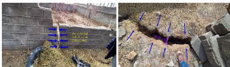
شکل ۷. الف: پراکندگی استخرهای پرورش ماهی در اطراف روستای خلج، ب، پ، ت و ث: گسترش شکاف‌های ایجادشده در شمال شرق روستای خلج، ج و چ: خسارت واردشده به ساختمان‌های موجود در شمال شرق روستای خلج، ح: پهنای شکاف‌های ایجادشده در شمال شرق روستای خلج