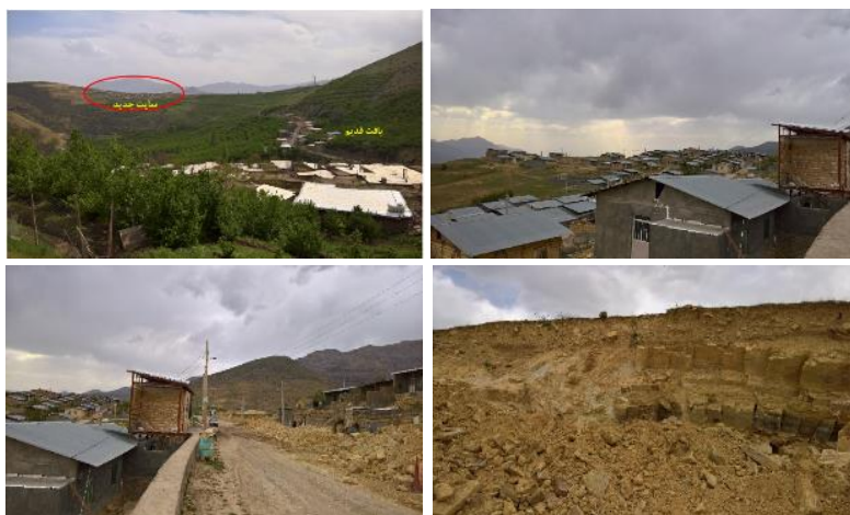
شکل ۹. الف: نمایی از روستای آکوجان (دید رو به جنوب)، ب و پ: بافت کالبدی و نوع ساخت‌وساز در سایت جدید روستای آکوجان، ت: مصالح تشکیل‌دهنده بستر سایت جدید روستای آکوجان که متشکل از توالی آهک رسدار و مارن است

باتوجه به بازدید میدانی انجام‌شده سایت جدید روستا بر روی واحدهای سنگی متشکل از آهک رس‌دار و مارن تشکیل شده است که نفوذپذیری پایینی دارد. بنابراین باتوجه به اینکه تعداد زیادی از اهالی در این سایت ساکن شده‌اند، برای جلوگیری از آلودگی‌های زیست‌محیطی و ایجاد پتانسیل حرکات دامنه‌ای و رخداد نشست (بر اثر فرسایش مارن‌ها)، از نفوذ آب به داخل زمین باید جلوگیری گردد.