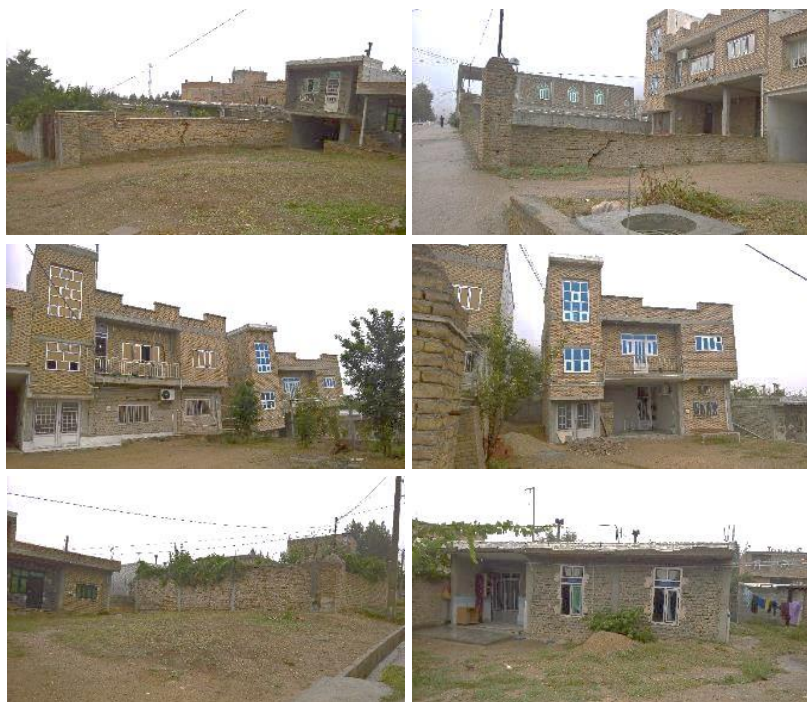
شکل ۲. الف: ترک خوردن دیوار بر اثر نشست زمین در شهر فراغی، ب: ترک خوردن دیوار بر اثر نشست زمین در شهر فراغی، پ: نشست ساختمان‌ها در شهر فراغی، ت: نمایی دیگر از وضعیت نشست ساختمان‌ها در شهر فراغی، ث: ترک خوردن دیوار بر اثر نشست در شهر فراغی، ج: ترک خوردن دیوار ساختمان بر اثر نشست در شهر فراغی

ژئوتکنیکی خاک محل؛ پس از سکونت اهالی و گذشت مدت‌زمان مشکلات ژئوتکنیکی خاک محل بروز نموده و باعث آسیب به منازل و تأسیسات شده است (شکل ۲).