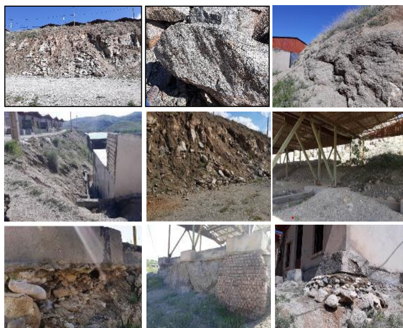
شکل ۱۵. الف: نمایی از سنگ بستر واحد گرانیته به شدت خردشده روستای گیجالی، ب: سنگ گرانیته موجود در سایت جدید روستای گیجالی، پ: نمایی از رخنمون گرانیته به شدت هوازده در محل سایت جدید روستای گیجالی، ت: نمایی از تجمع واریزه‌ها در پشت دیوار واحدهای مسکونی در روستای گیجالی، ث: رها شدن بلوک‌های سنگی در پایین‌ترین برم سایت جدید روستای گیجالی، ج: هجوم واریزه‌های حاصل از هوازدهی گرانیته در شیب مشرف به ساختمان‌ها در روستای گیجالی، چ: قرارگیری پی بر روی بستر ضعیف و فرسایش آن در روستای گیجالی، ح: قرارگیری پی بر روی مصالح خاک دستی و گرانیته شدیداً هوازده در روستای گیجالی و خ: قرارگیری پی بر روی بستر ضعیف در روستای گیجالی، برگرفته از مطالعات ایمن سازی روستای گیجالی بالا

به صورتی که توده گرانیته دیگر خصوصیات یک سنگ را حداقل تا عمق سه متری ندارد و بیشتر خاک است تا سنگ. باتوجه به عملیات خاکی انجام شده (ایجاد برم‌های عریض جهت احداث ساختمان)، رخنمون سنگ‌های گرانیته در برخی نقاط دیده می‌شود (شکل ۱۵). توده گرانیته به شدت هوازده و درزه‌دار است. آب‌وهوای کوهستانی مرطوب و تکتونیزه بودن منطقه از عوامل اصلی هوازدهی شدید توده است. در محل سایت جدید ضخامت خاک‌های حاصل از هوازدهی و آبرفت‌های عهد حاضر متفاوت است.