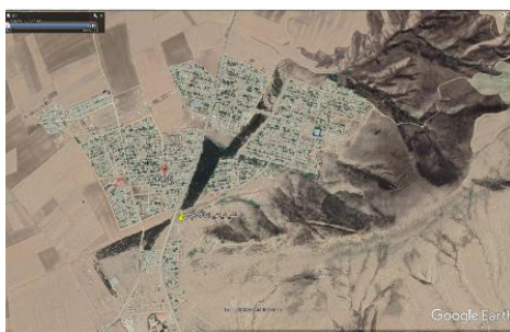
شکل ۱. نمایی از شهر فراغی بر روی تصویر، تاریخ تصویر: ۲۰۲۲/۰۸/۲۳

سایت جدید روستاهای جابه‌جا شده به شهر فراغی از توابع شهرستان کلاله استان گلستان در مختصات طول جغرافیایی ۵۵،۵۹ درجه شرقی و عرض جغرافیایی ۳۷،۵۳ درجه شمالی قرار دارد (شکل ۱). سایت جدید روستاها بر روی نهشته‌های آبرفتی و لسی با ضخامت زیاد قرار گرفته است. با توجه به رخداد سیل در مرداد سال ۱۳۸۴ و آسیب‌های واردشده به روستاها و تصمیمات مسئولین وقت، تعداد ده روستا شامل قزل‌طاق، آق‌تقه، خوجه‌لر، کوروک، چاتال، قپان علیا، قپان سفلی، پاشائی، ارازعلی شیخ، و قره‌سعید شهرستان کلاله در محلی در حوالی روستای پیشکمر تجمع شدند. محل تجمع روستاهای مذکور در ابتدا به دلیل نزدیکی به روستای پیشکمر، به سایت «پیشکمر» مشهور بود و در سال ۱۳۹۱ نام شهر فراغی تغییر نام داد. با توجه به عدم انجام مطالعات زمین‌شناسی و ژئوتکنیک قبل از انجام تجمع و جابه‌جایی روستاها، پس از گذشت مدت‌زمانی از اسکان اهالی، به دلیل شرایط نامناسب زمین‌شناسی و نحوه دفع فاضلاب و آب‌های سطحی به احتمال زیاد در برخی نقاط شهر فراغی نشست ساختمان‌ها و ترک‌خوردگی دیوارها نمایان شد که در حال حاضر امکان ساخت‌وساز در این مناطق شهر وجود نداشته و ساکنین در معرض خطر نشست ساختمان‌ها هستند که برخی آثار و شواهد نشست در تصاویر زیر نمایش داده شده است.