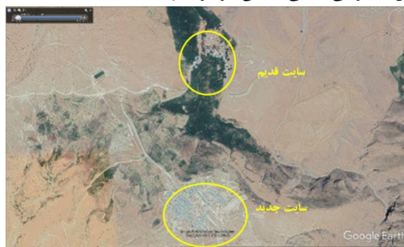
شکل ۸. موقعیت سایت قدیم و جدید روستای آکوجان بر روی تصویر بر گرفته از Google Earth، تاریخ تصویر: ۲۰۲۰/۰۶/۲۲

سنگ نفوذپذیری پایینی دارد و به همین دلیل اجرای شبکه فاضلاب ضروری است. سایت جدید معیشت محور نبوده، روستائیان محل نگهداری دام ندارد و از باغات خود دور هستند. در شکل ۹-ب و ۹-ت نمایی از بافت کالبدی روستا در سایت جدید نشان داده شده است. مسجد، مدرسه و مرکز بهداشت در محل سایت قدیم روستا قرار دارد و اهالی ساکن در سایت جدید علی‌الخصوص در فصول سرد سال دسترسی آسانی به این مراکز ندارند.