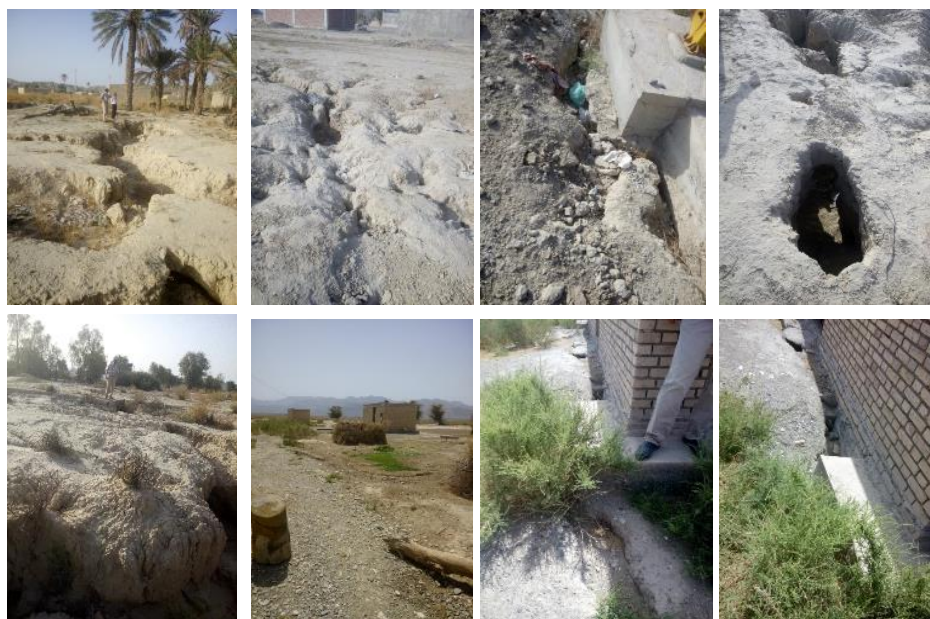
شکل ۱۳. الف، ب، پ، ت و ث: تصاویر مربوط به مخاطرات سایت جدید روستای شارب ماء و ج، چ، ح و خ: تصاویر مربوط به مخاطرات سایت جدید روستای سلیمان آباد

سایت جدید روستای سلیمان آباد از توابع شهرستان فاریاب استان کرمان در مختصات طول جغرافیایی ۵۷,۲۹ درجه شرقی و عرض جغرافیایی ۲۸,۰۹ درجه شمالی قرار دارد (شکل ۱۲). سایت جدید روستا بر روی نهشته‌های آبرفتی با ضخامت زیاد قرار گرفته است. در محدوده این روستا آثار و شواهد فرسایش تونلی در آبرفت قابل مشاهده است (شکل ۱۳-ج، چ، ح و خ). این روستا در نزدیکی محل احداث شهرک صنعتی واقع شده است. بنا به گفته مسئولین شهرستان فاریاب، با مطالعات ژئوفیزیکی و ژئوتکنیکی انجام شده در محدوده محل احداث شهرک صنعتی، به وجود خطر بسیار شدید فرونشست پی برده‌اند. در محدوده روستای سلیمان آباد نیز آثار و شواهد فرونشست دیده می‌شود.