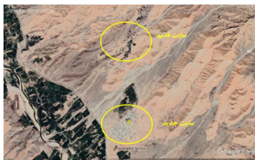
شکل ۶. موقعیت سایت قدیم و جدید روستای خلج بر روی تصویر برگرفته از Google Earth، تاریخ تصویر: ۲۰۲۱/۰۴/۰۵

توپوگرافی سایت جدید روستای خلج باتوجه به نقشه زمین‌ریخت‌شناسی به‌گونه‌ای است که روستا در دشت واقع شده و ارتفاع متوسط آن از سطح دریا در حدود ۱۳۳۰ متر است و بالادست روستا به‌صورت تپه‌ماهوری است. میزان خط ارتفاعی تا ۳ کیلومتری شمال آن به حدود ۱۵۰۰ متر از سطح دریا می‌رسد و بالاتر از آن ریخت‌شناسی کوهستانی بوده و میزان ارتفاع تا ۲۳۰۰ متر از سطح دریا نیز می‌رسد. بررسی‌ها نشان می‌دهد که محدوده کالبدی روستا در پهنه ناهمواری قرار دارد. شمال روستا در بلافصل دشت و ارتفاعات قرار داشته و اختلاف شمال و جنوب روستا حدود ۳۰ متر است. شیب عمومی روستا کمتر از ۵ درصد است. محدوده سایت جدید روستای خلج بر روی واحد Qt2 قرار می‌گیرد. این واحد شامل تراس و پادگانه‌های آبرفتی جوان است. این نهشته‌ها عموماً با سیمای دشتی در پای ارتفاعات گسترش و پراکندگی دارند و به علت تأثیر و عملکرد محدود فرایندهای دیاژنز از سخت‌شدگی و سیمان‌شدگی کمی برخوردارند و به همین دلیل این واحد پهنه‌های نسبتاً همواری را تشکیل داده است. بافت قدیمی روستای خلج در سال ۱۳۸۸ بر اثر زمین‌لغزش دچار آسیب جدی شده که در آن زمان بر اساس تصمیم مقامات مربوطه، جابه‌جایی روستا به منطقه دیگری انجام شده است. سایت جدید روستا در پایین‌دست بافت قدیمی و در فاصله ۱۵۰۰ متری از آن قرار دارد و اهالی در سال ۱۳۹۰ به روستای سایت جدید نقل مکان نموده‌اند. موقعیت مکانی سایت جدید بر روی مخروط افکنه‌های کم شیب قرار دارد و رودخانه قزل اوزن در فاصله ۱۰۰۰ متری از پایین‌دست آن عبور می‌کند. باتوجه‌به قرارگیری سایت جدید در پایین‌دست حوضه آبریز، چندین آبراهه و مسیل از اطراف آن عبور کرده و آن را احاطه کرده است (شکل ۷).