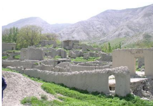
شکل ۴. نمایی از سایت قدیم روستای قره چای

دارای مصالح مستعد لغزش (خاک‌های با دانه‌بندی ریزودرشت که حاوی سیلت و رس و قطعات تخریبی است) و شیب نامناسب بوده است. نفوذ آب‌های سطحی به داخل توده لغزشی باعث بالا رفتن سطح آب زیرزمینی، فشار منفذی و وزن توده می‌شود.