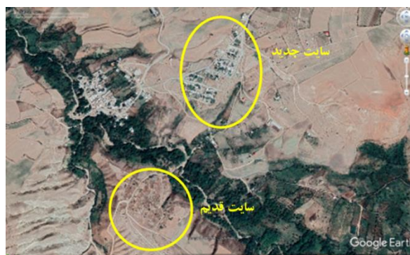
شکل ۱۶. محدوده سایت قدیم و جدید روستای عرب بر روی تصویر برگرفته از Google Earth تاریخ تصویر: ۲۰۲۱/۰۴/۰۵