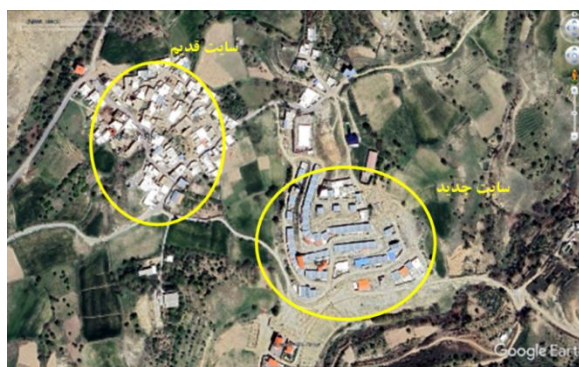
شکل ۱۴. موقعیت سایت جدید و قدیم روستای گیجالی بالا بر روی تصویر برگرفته از Google Earth، تاریخ تصویر: ۲۰۲۳/۰۴/۲۰

این سایت بعد از زلزله سال ۱۳۸۵ سیلاخور برای روستای مذکور در نظر گرفته شده است. سایت جدید روستا بر روی توده گرانیتی و خاک‌های برجا حاصل هوازگی آن و در برخی از نقاط آبرفت‌های عهد حاضر استقرار یافته است. آنچه در بررسی‌های صحرائی مشخص شد، هوازگی شدید توده گرانیتی در محل روستای جدید است (شکل ۱۵).