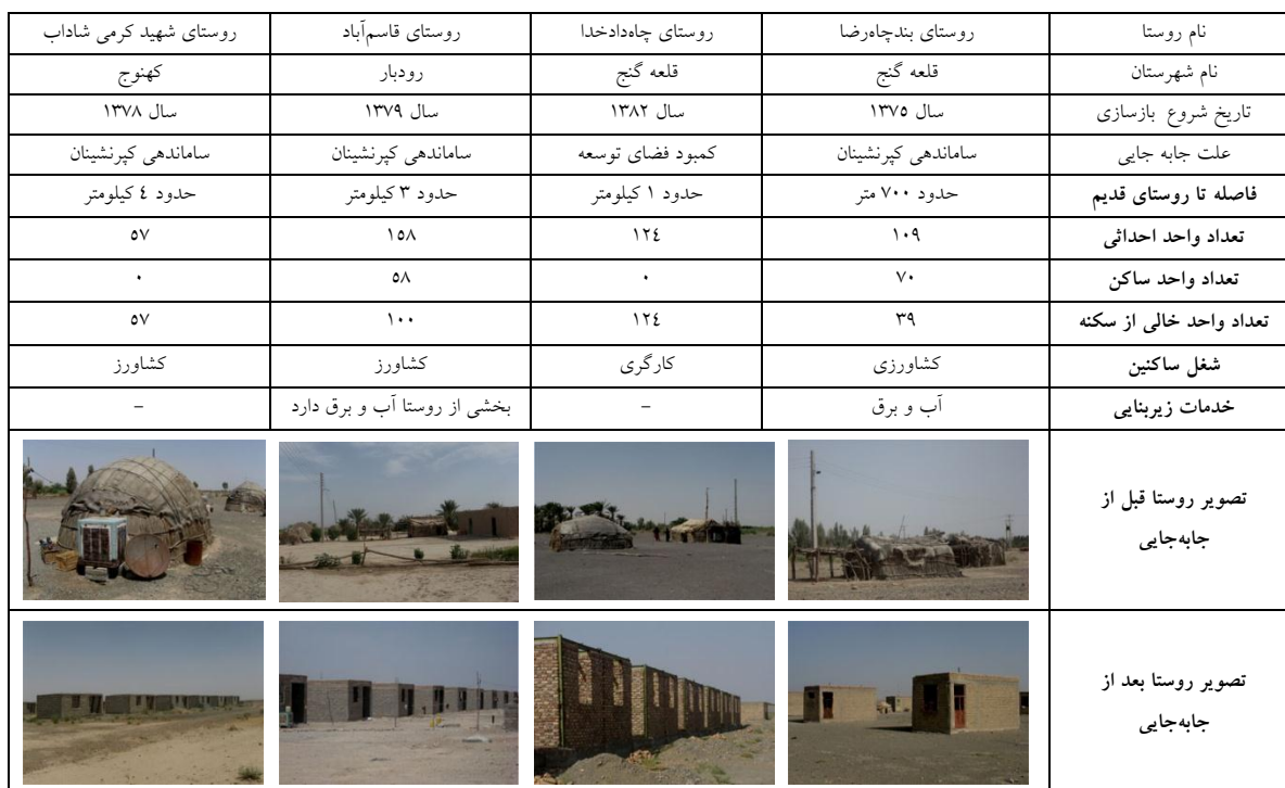
ج ۲. معرفی روستاهای مورد مطالعه ۱۷

چگونگی توزیع حجم نمونه در روستاهای مورد مطالعه در "جدول ۳" ارائه شده است. در ذیل به ارائه توزیع فراوانی یکی از سؤالات پژوهش در گروه‌های مورد مطالعه می‌پردازیم "جدول ۴".