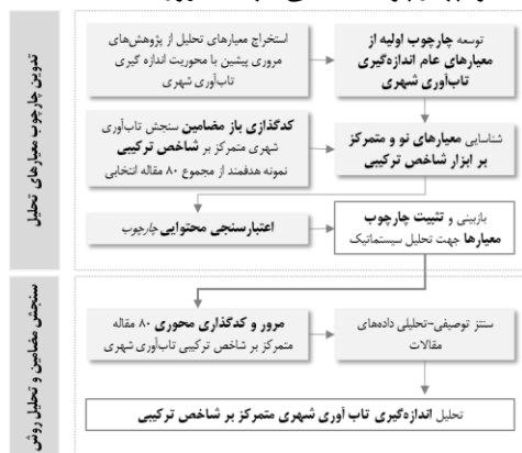
شکل ۲. روند تدوین چهارچوب تحلیلی جهت مرور سیستماتیک مقالات

پژوهش حاضر عناصر حاصل از مرور چهارچوب‌محور و تحلیل تماتیک استقرایی را در راستای بهره‌گیری از دانش تثبیت‌شده پیشین در عین حفظ انعطاف‌پذیری لازم برای شناسایی مفاهیم نوظهور تلفیق کرده است. این فرایند در مراحل متوالی و بازبینی‌شونده مطابق شکل ۲ به اجرا درآمد و چهارچوب تحلیلی جهت مرور سیستماتیک مقالات تدوین گردید (جدول ۲).