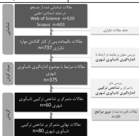
شکل ۱. روند گزینش مقالات