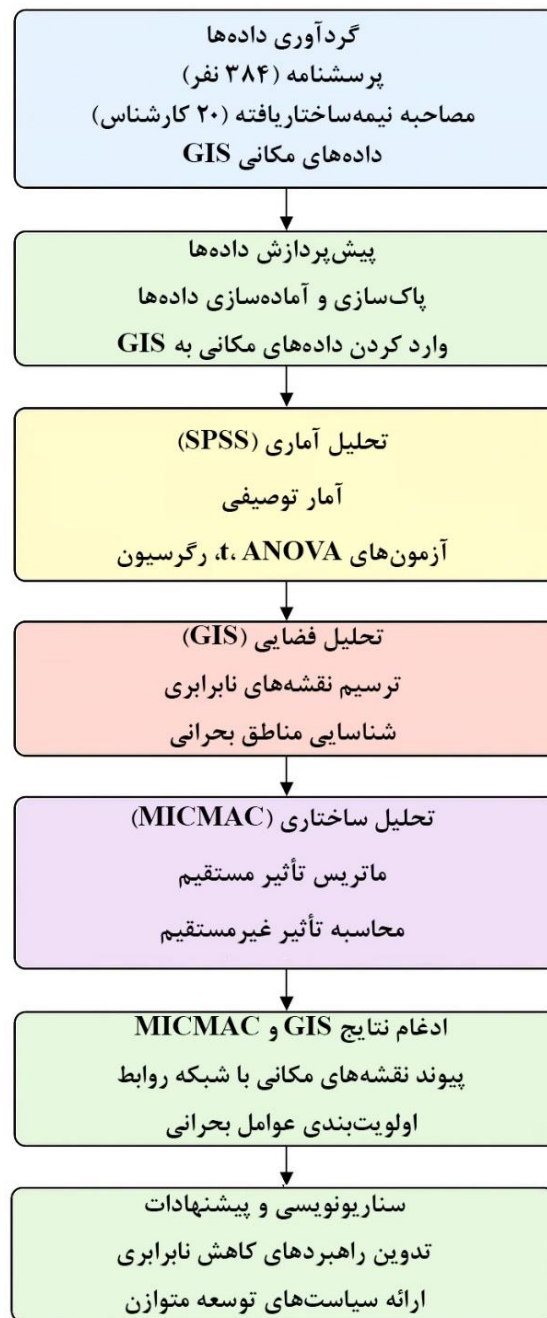
شکل ۱. فرآیند اجرای پژوهش با رویکرد ترکیبی GIS-MICMAC