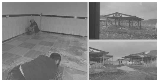
ت ۲. بازسازی مسکن دائم توسط بازماندگان، قوچی باشچی، پس از زمین‌لرزه ۱۳۹۶ کرمانشاه، مأخذ: نگارندگان.

اگرچه روستاییان نمی‌توانند دخالتی در طرح و نقشه اولیه در این مرحله از بازسازی داشته باشند اما تزیینات و نوع مصالح را بر طبق نظر خود در داخل و یا خارج بنا انتخاب می‌نمایند (تصویر شماره ۲). همین امر می‌تواند برخی از ناهماهنگی‌های طرح و بستر را تقلیل دهد. در صورت ادامه این روند و فرهنگ‌سازی در راستای ساخت و ساز ایمن و مقاوم در برابر زلزله‌های احتمالی، پس از خروج متولیان و کمتر شدن نظارت‌ها، انتظار ایجاد مشارکتی توانمند و کنترل اجتماعی در جامعه آسیب دیده وجود دارد.