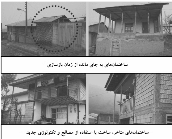
ساختمان‌های به جای مانده از زمان بازسازی

انجام گرفته است. با توجه به مصاحبه‌های عمیق انجام شده با ساکنان محلی به منظور درک روند تغییرات در روابط فضاهای داخلی خانه‌های روستایی در این قریب به سی سال پس از بازسازی، تغییرات گسترده در راستای تطبیق هرچه بیشتر سکونتگاه با شرایط، نیازها و خواست‌های ساکنان آن مشاهده می‌شود (تصویر شماره ۳). بخش‌های مختلفی بر مسکن افزوده شده و هسته‌های اولیه زیگالی همچنان مورد استفاده هستند. این هسته‌ها در برخی موارد به انبار تبدیل شده و یا در گسترش خانه، در میان سایر اتاق‌ها مضمحل شده‌اند. باید توجه داشت که در مصاحبه‌ها عموماً سؤالاتی در راستای سنجش میزان رضایت افراد از نوع طراحی سکونتگاه‌ها مورد پرسش قرار گرفته‌اند. تعداد فضاهای موجود، نوع و نحوه قرارگیری آن‌ها، ارتباط بین فضاها در داخل و خارج مجموعه سکونتی، با توجه به نیازها و خواست‌های خانوار مورد سنجش قرار گرفته است.