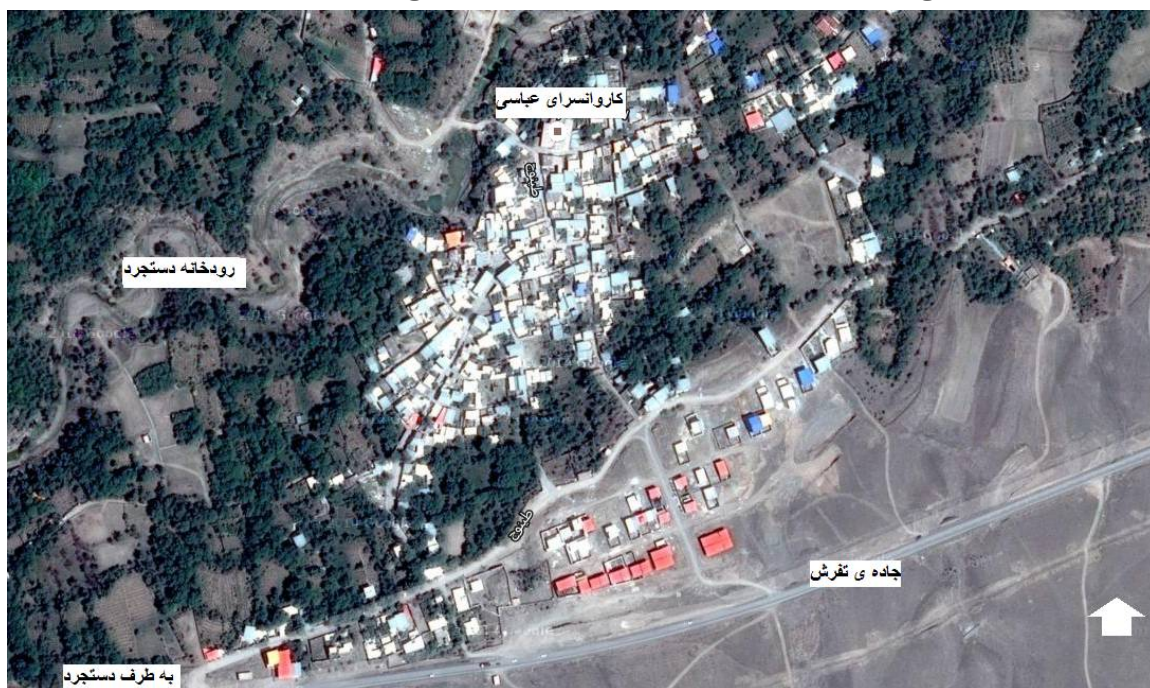
ت 1. موقعیت جغرافیایی روستای طینوج. http://www.behrah.com/map.php

شناسایی و آمار و اطلاعات دقیق آن‌ها از مراجع ذیربط اخذ گردید و سپس با توجه به ضرایب استحصال و میزان تولید فضولات هر رأس دام، مقدار فضولات قابل دسترس هر دام برای تولید بیوگاز محاسبه گردیده است که در نتیجه آن مشخص گردید استان قم یکی از پنج استان اول، دارای منابع بالقوه زیست‌توده است