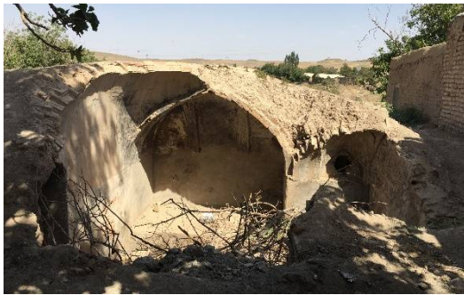
ت 6. آثار بجا مانده از معماری کویری طینوج. (نگارندگان، تیر 1394).

یکسان دارند. به کارگیری کلیه عوامل اقلیمی جهت ایجاد حرارت و یا برودت مورد نیاز، جزو اصول اولیه معماری سنتی ایران بوده است. همان گونه که از تابش آفتاب و مصالح ساختمانی جهت تأمین و ذخیره نمودن حرارت استفاده می‌شده، سرمای زمستان، دمای بسیار پایین آسمان در شب هنگام و عایق بودن نسبی عمق زمین نیز به منظور ایجاد برودت و ذخیره آن مورد استفاده قرار می‌گرفته است. باید گفت که کاربرد معماری اقلیمی و نحوه استفاده از اقلیم و معماری در جهت تأمین شرایط بهینه عملکرد گوارنده در طی فصول مختلف سال و در مناطق آب و هوایی در جای جای قلمرو معماری گذشته ثابت شده است. همانگونه که در بخش‌های قبل گفته شد قرارگرفتن گوارنده در محدوده 25 تا 35 درجه سانتیگراد از الزامات عملکرد مناسب فرایند هضم است. معماری اقلیمی ایران با استفاده از فرم و مصالح ساختار پایداری را خلق کرده است که می‌تواند در مناطق کویر نیز تغییرات عمده دما شب و روز را کنترل کند (تاری، 1394).