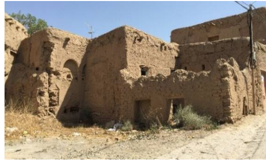
ت 2. قلعه طوسی نوژ. (نگارندگان، تیر 1394).