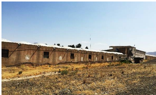
ت 4. یک واحد مرغداری گوشتی در طینوج. (نگارندگان، تیر 1394).

همچنین 32 واحد گلخانه‌های موجود در مجاورت روستای طینوج نیز می‌توانند از کود حاصله از گوارنده زیست‌توده برای تولید محصولات ارگانیک استفاده کرده و برق مورد نیاز خود را از این فرایند تأمین نمایند.