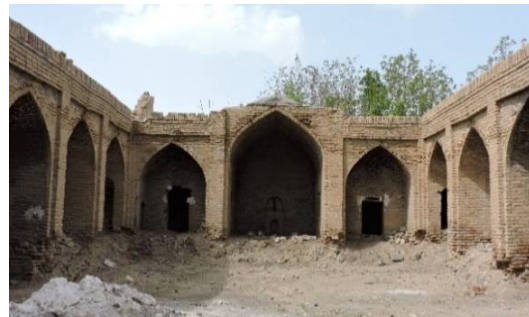
ت 3. کاروانسرای عباسی. (نگارندگان، تیر 1394).