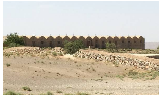
ت 5. یک واحد مرغداری گوشتی در طینوج. (نگارندگان، تیر 1394).

استفاده از مصالح بوم‌آورد یک از ارکان معماری ایران است (پیرنیا، 1383). این مصالح باعث تکمیل فرایند عایق‌سازی بنا در برابر تغییرات دمایی خواهد بود و مشکلات مربوط به حمل و نقل مصالح از دوردست به