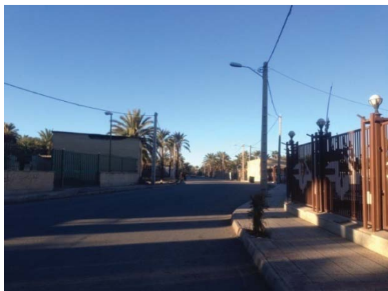
ت ۱. محله امامزاده زید.

محله امامزاده زید همراه محله سید طاهرالدین در شرق بم واقع شده است.