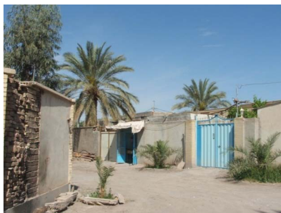
ت۳. محله قصر حمید.

محله قصر حمید از محلات اولیه شکل گرفته بعد از خارج شدن توسعه شهر از ارگ است که پیش از سال ۱۲۸۵ نیز وجود داشته و جایگاه سکونت اولیه خوانین بمی بعد از خروج از ارگ بوده است. قرارگیری در مرکز شهر و همجواری با بازار شهر از ویژگی‌های اصلی این محله به‌شمار می‌آید.