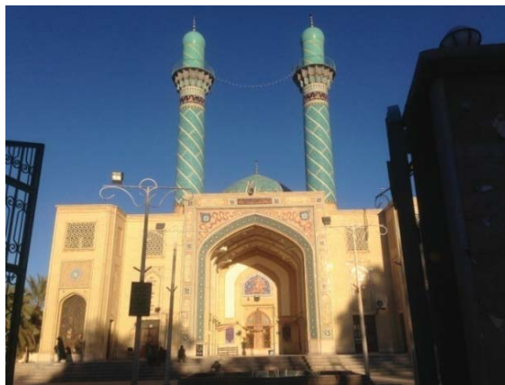
ت۲. بنای امامزاده زید.

حدود ۲۱۵۹ نفر بوده که بعد از وقوع زلزله به ۱۵۲۴ نفر کاهش یافته است. درصد تخریب محله نیز بالای ۸۰ درصد بوده است. در حال حاضر جمعیت محله حدود ۲۰۰۰ نفر و میزان بازسازی‌های انجام‌شده واحدهای مسکونی مطابق مطالعات میدانی حدود ۸۵ درصد است.