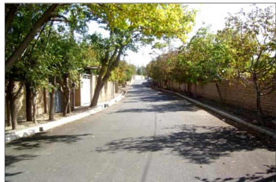
روستای دهنو - استان مرکزی