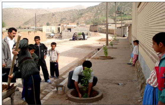
روستای گاومیر - استان خوزستان

را تامین می‌نماید. ضمن اینکه همکاری روستاییان در فعالیتهای اجرایی پروژه‌های طرح هادی به نوعی آموزش غیرمستقیم محسوب می‌گردد. در نتیجه می‌تواند تسهیل‌گر امور مربوط به حفظ و نگهداری پروژه‌ها و ترمیم آسیب دیدگیها نیز بشمار آید. بر این اساس، وظیفه و هدف اصلی بنیاد که الگوسازی انواع فعالیتهای اجرایی است نیز تامین می‌گردد.