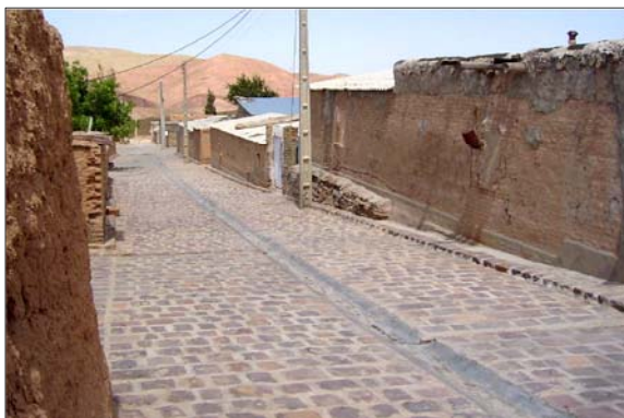
روستای بهشتیان - استان قزوین

طی سه سال اول برنامه چهارم نیز مجموعاً ۶۵۳۸ طرح هادی روستایی تهیه گردید. طی سالهای گذشته، وزارت جهاد سازندگی نیز اقدام به تهیه ۱۰۹۸ طرح هادی طی برنامه‌های دوم و سوم نمود. بر این اساس مجموعاً تا پایان سال ۱۳۸۶ بالغ بر ۱۸۴۶۹ طرح هادی روستایی تهیه شده است. لازم به ذکر است که در طول برنامه چهارم مقرر گردید در ۱۲۰۰۰ روستای بالای ۵۰ خانوار (شامل طرحهای بازنگری و جدید) طرح هادی تهیه شود. بر این اساس طی سالجاری و آتی تهیه بالغ بر ۴۶۸۷ طرح در دستور کار بنیاد قرار دارد.