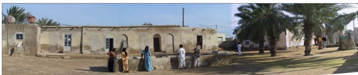
تصویر ۶- هماهنگی مسکن بومی با اقلیم و معیشت - جزیره شیخ بوشهر

دشت‌هایی که به آب دسترسی دارند مستقر شده‌اند. استقرار در مناطق پایکوهی بدلیل اثرات تعدیل کننده اقلیم کوهستان و مصون ماندن از شرایط بیابانی و کویری و دسترسی به آب و شیب مناسب بسیاری از روستاها را از مزیت‌های طبیعی خوبی برخوردار نماید.