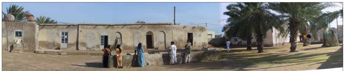
تصویر ۶- هماهنگی مسکن بومی با اقلیم و معیشت - جزیره شیف بوشهر

دشت‌هایی که به آب دسترسی دارند مستقر شده‌اند. استقرار در مناطق پایکوهی بدلیل اثرات تعدیل کننده اقلیم کوهستان و مصون ماندن از شرایط بیابانی و کویری و دسترسی به آب و شیب مناسب بسیاری از روستاها را از مزیت‌های طبیعی خوبی برخوردار نماید.