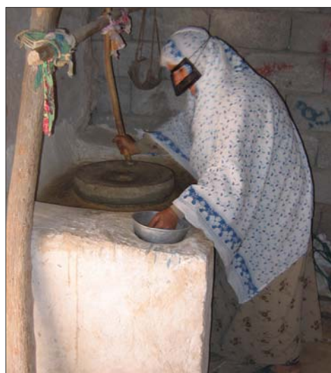
تصویر ۳: طرح و اجرای عناصر فضایی متناسب با نیاز خانوار مسکن: آسیاب دستی خانگی - روستای گزیر، استان هرمزگان

هرگونه دخالت کالبدی در این بافتها باید با توجه به حفظ میراث معماری و وحدت و هماهنگی آنها صورت پذیرد. بی توجهی به ارزش های موثر در شکل گیری کالبد باعث شده تا بافت های جدید علی رغم