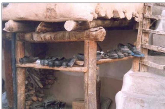
تصاویر ۴ و ۵: طرح و اجرای عناصر فضایی متناسب با نیاز خانوار مسکن: کفش کن و اجاق سنتی که سوخت آن با هیزم و پسماندهای حیوانی تامین می شود- روستای کزج اردبیل

علی رغم پیشینه دانش و فن آوری بومی ساخت و ساز در مناطق روستایی و مصداق های مناسبی که در این زمینه وجود دارد؛ در طرحهایی که طی سالهای