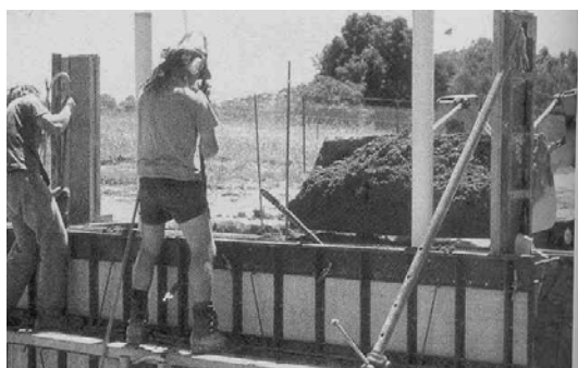
ب: ساخت دیوار خاک کوبیده توسط دانشجویان دانشگاه چارلز استورت در نیوساوتولز استرالیا.