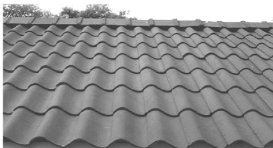
ب: بام شیبدار با استفاده از این مصالح