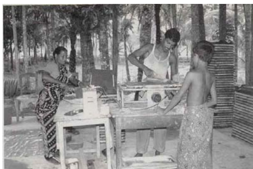
الف: تولید پوشش بام میکروبتنی

داد. با استفاده از این سنگدانه‌های حاصل از ضایعات آجر می‌توان بتن نیمه‌سبک با چگالی ۲۰۰۰ تا ۲۰۸۰ کیلوگرم بر مترمکعب تولید کرد. هنگام استفاده از این سنگدانه‌ها در بتن درصد بیشتری از آب مورد نیاز است. استفاده از سنگدانه آجر اغلب نتایج امیدوارکننده‌ای داشته است.