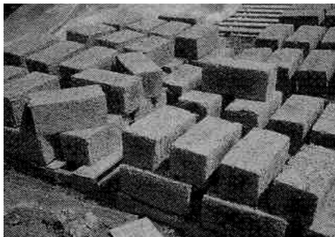
الف: بلوک‌های رس - سبک در حال خشک شدن بر روی طبق‌های چوبی (پالت). این بلوک‌ها را می‌توان با دوغاب رسی مخلوط شده با تراشه‌های چوب، کاه و سایر الیاف طبیعی تولید کرد.

رس سبک استفاده از چوب را در ساختمان کاهش می‌دهد. همه بخش‌های پر شونده بالای پی مانند دیوارهای داخلی و خارجی، سقف و عایق کاری بام را می‌توان با تنوعی از رس سبک ساخت. قالب‌ها