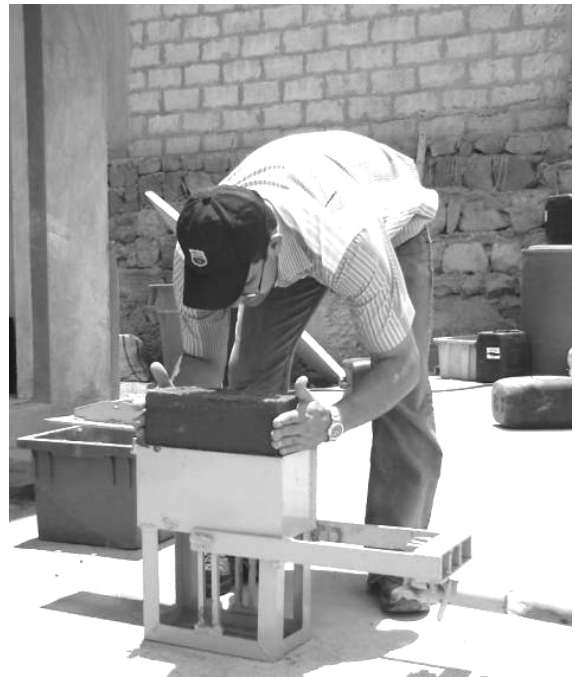
تصویر ۱- تولید بلوک‌های متراکم و تثبیت شده در مناطق کم درآمد

کارگر، کیفیت بالاتر و هزینه ساخت کمتر را تضمین می‌کند و اعتماد و اتکا به خود را گسترش می‌دهد.