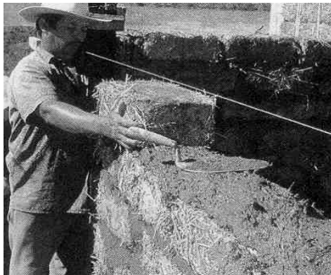
ب: اجرای دیوار رس - سبک