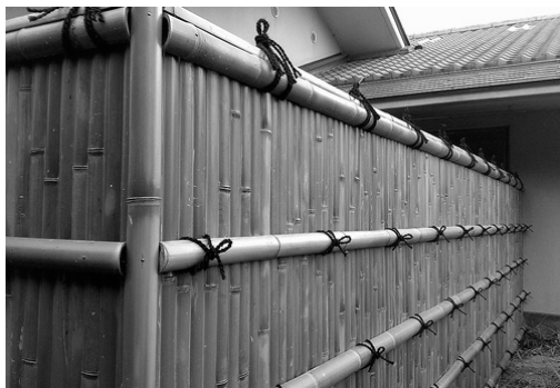
تصاویر ۷- دیوارهای ساخته شده با ساقه بامبو