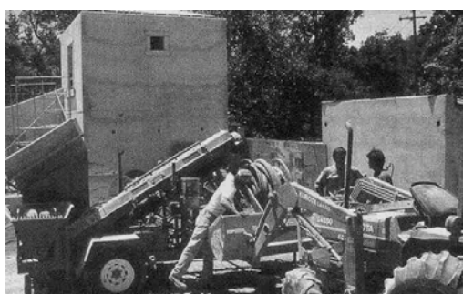
الف: یک تراکتور برای بار کردن، یک دستگاه مخلوط کن، کوبه دستی، و یک کمپرسور بزرگ که وسایل مورد نیاز در سازه خاک کوبیده را تشکیل می‌دهند.