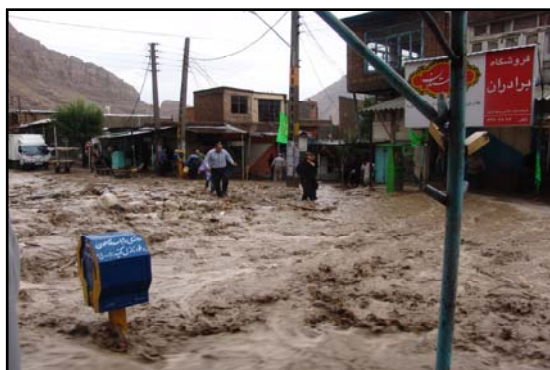
عکس شماره ۲: نفوذ سیل به داخل بخش مرکزی و تجاری شهر