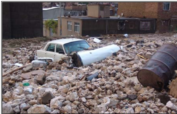
عکس شماره ۴: نفوذ سیل و تخریب آن در قسمت محله شهر