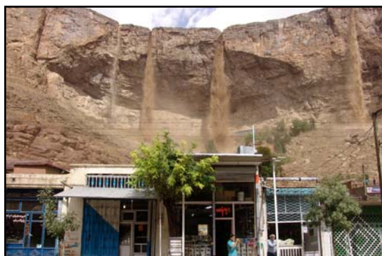
عکس شماره ۱: جاری شدن سیل از بالای کوه قیه داغ به داخل شهر

و بافت تجاری اصلی شهر، تهدید می‌شود (عکسهای شماره ۱ و ۲).