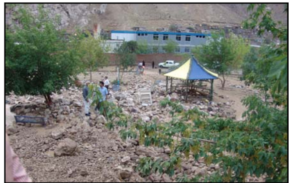
عکس شماره ۳: نفوذ سیل و تخریب آن در قسمت شرقی شهر (پارک محله بشگوز)

زیاد شده و در طی زمان قابلیت زلزله زایی را افزایش می‌دهد (مصیب زاده، ۱۳۸۶: ۶۸).