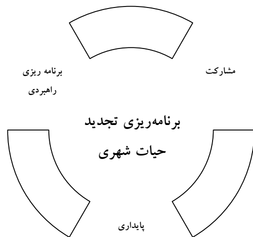
شکل شماره ۱: ارکان اصلی برنامه ریزی تجدید حیات شهری

مشارکت، راهبرد و پایداری سه رکن اصلی تجدید حیات شهری را تشکیل می دهند. این سه رکن، پایه ای را برای اقدام جامع و تفصیلی ارائه می نمایند و هریک نقش ویژه ای را در رهیافت تجدید حیات شهری ایفاء می کنند (شکل شماره ۱). در ادامه این سه رکن مورد بررسی قرار می گیرد