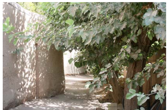
تصویر شماره ۳: کوچه-باغی در محله نعیم آباد

آبادی‌ها بر اساس دو عامل طبیعی آب و گیاه شکل گرفته و در آنها طبیعت نقش یک عنصر اصلی از سیستم کل را بر عهده داشته که در اشکال گوناگون حضور یافته است. از مشخص‌ترین شکل حضور طبیعت می‌توان به باغ اشاره کرد که ابعاد متفاوتی از حضور این پدیده در زندگی خصوصی مانند حیاط خانه‌ها و زندگی جمعی مانند فضاهای سبز عمومی را می‌توان برشمرد. در آبادی‌ها الگوهای بی‌نظیر پیوند،