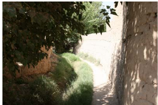
تصاویر شماره ۱ و ۲: مسیری ارگانیک در محله نعیم آباد

در وصف آنها شعرها سروده و مورخان در توصیف آنها تشبیهات و صنایع ادبی به کار می‌گرفتند. به طور مثال در ذکر باغ امیر شمس الدین محمد میرک پسر امیر جلال الدین چقماق آمده است: