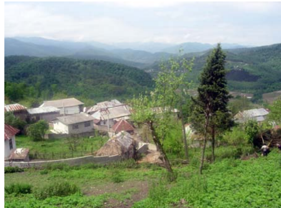
تصویر ۲: نمایی از روستای کارمزد، شهرستان سوادکوه، استان مازندران