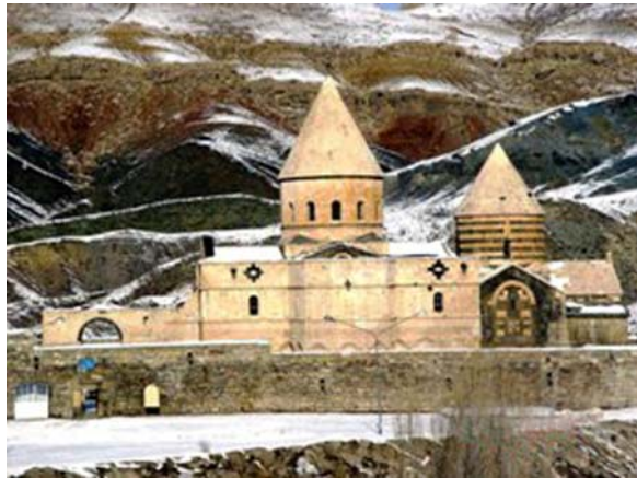
تصویر ۸: کلیسای طاطاوس، روستای قره کلیسا، شهرستان چالدران.

گردشگری به موقعیت خودمان از لحاظ جاذبه‌های اکوتوریستی یعنی رتبه پنجم جهان برسانیم، بدون شک گام بسیار مؤثر و مثبتی در زمینه توسعه روستاها برداشته شده است. آنچه در اینجا مهم به نظر می‌رسد، آموزش مردم و مجریان و نگاه علمی و آینده‌نگری برنامه‌ریزان به صنعت گردشگری به عنوان یکی از ارکان اساسی برای توسعه مناطق روستایی است.