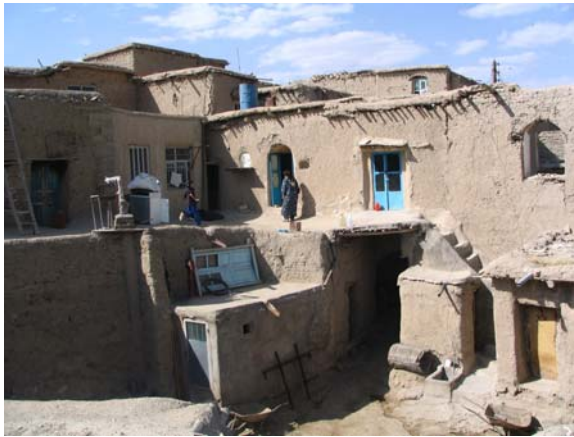
تصویر ۳: بافت سنتی روستای افراونده، شهرستان دورود، استان لرستان