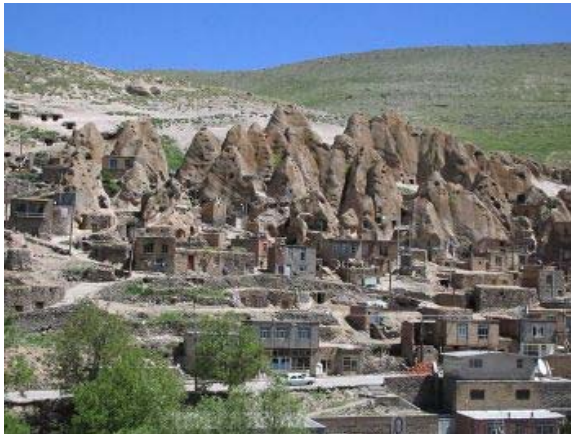
تصویر ۴: بافت سنتی و خانه‌های منحصراً بفردهای روستای تاریخی کندوان، استان آذربایجان شرقی

غیرمستقیم بسیاری نیز دارد. از جمله اینکه رویدادهای که برای گردشگران برنامه‌ریزی می‌شود، ساکنان محلی را نیز جذب می‌کند همچنین بالا بردن کیفیت و شرایط زندگی به منظور جذب گردشگران دائمی، ساکنان را نیز متفع می‌سازد (فرزین پاک، ۱۳۸۴).