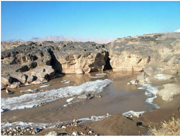
تصویر ۵: چشمه‌ها و آبهای جاری از میان صخره‌ها و سنگهای آذرین در اطراف روستای سنگر، شهرستان ماکو

رقابت بخش‌های کشاورزی، صنایع و خدمات همراه با مصارف خانگی و دیگر کاربری‌ها برای دستیابی به آب شیرین در بسیاری از کشورها و مناطق به سرعت به یکی از مهمترین مسایل مربوط به منابع طبیعی تبدیل شده است. گسترش شتابان صنعت گردشگری که به آب بسیار زیادی احتیاج دارد، می‌تواند با فشار آوردن بر روی ذخایر نادر آب در بسیاری از مکان‌ها این مسئله را وخیم‌تر کند.