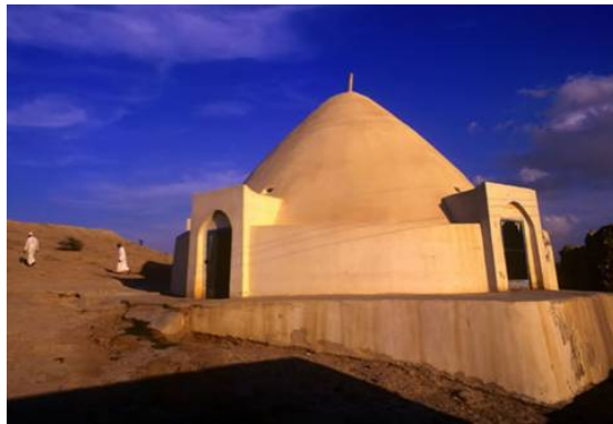
تصویر شماره ۳: آب انبار، بندر لافت.

چاه‌های تلا و آب انبار اصلی روستا جاری می‌شوند. شکل‌گیری بافت در لایه بالایی آن به صورتی است که آب جاری از تپه‌ها، وارد بافت نشود. در روزهای بارانی شدید، در محدوده چاه‌ها دریاچه‌ای تشکیل شده و آب انبار اصلی روستا پر از آب می‌شود. در این ایام این محل به عنوان یک مکان تفریحی در سطح منطقه قشم مورد استفاده قرار می‌گیرد. سرریز آب چاه‌ها و آب انبار از محوطه اطراف مسجد جامع به دریا می‌ریزد. در حال حاضر با امکان انتقال آب از شهر قشم توسط مخزن‌های سیار آب، در حیاط هر واحد مسکونی مخزن آبی در داخل زمین تعبیه شده است (نوربخش، ۱۳۸۰، ۱۴۳).