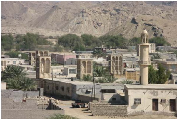
تصویر شماره ۱۱: استفاده از بادگیر و بام‌های مسطح در ساختار ابنیه. تاریخ برداشت تصویر: ۱۳۸۷