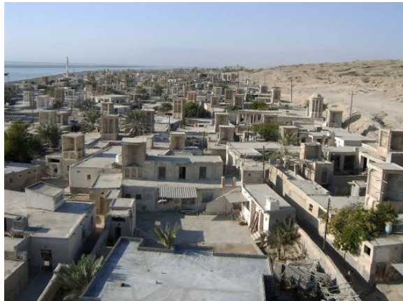
تصاویر شماره ۸: بافت روستایی بندر لافت و گسترش آن به صورت بافت شهری در امتداد ساحل دریا

مأخذ: نگارندگان، تاریخ برداشت تصویر: ۱۳۸۰