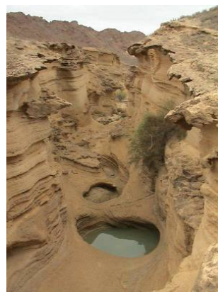
تصویر شماره ۶: مجراهای طبیعی آب باران در بندر لافت - تاریخ برداشت تصویر: ۱۳۸۰

بهترین روش برای مقابله با شرایط سخت آب‌وهوایی در این منطقه، ایجاد سایه و استفاده از جریان باد است. این مطلب برای ساکنان محل و کسانی که به این مناطق در ایام گرم سال مسافرت کرده‌اند، امری مشهود و مسلم است. در حالی که در