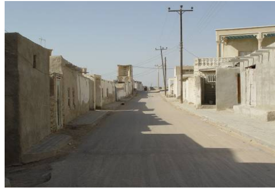
تصاویر شماره ۷: بافت روستایی لافت و روش‌های سایه‌اندازی در معابر. مأخذ: نگارندگان، تاریخ برداشت تصویر: ۱۳۸۰

ب) علاوه بر آن، در قسمت مرکزی جزیره قشم نیز روستاهای متعددی هست که علت آن، به رغم ناهمجواری یا دریا، وجود منابع آب قابل شرب است. جهت دسترسی این چند روستا و نیز دسترسی مرکزی به تمام روستاهای حاشیه جزیره یک راه اصلی در میانه جزیره احداث شده است (ثروتی، ۱۳۷۸، ۸۹).