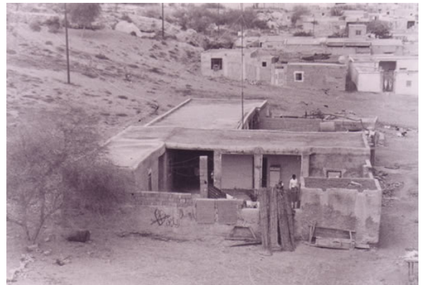
تصویر شماره ۱۰: فرم ابنیه بافت روستایی، بندر لافت تاریخ برداشت تصویر: ۱۳۸۰

فصول گرم در شب هنگام، به دلیل خنکی نسبی هوا بر روی بام و تابش حرارت از زمین و بام گرم به آسمان نسبتاً سرد، اهالی بر روی بام می‌خوابند و جان پناه اطراف بام اغلب مشبک می‌باشد تا ساکنان بر روی بام از دید اطراف محفوظ باشند و در عین حال از کوران هوا بر روی بام استفاده کنند. در اینجا لازم به ذکر است که به لحاظ تبادل تجاری بین بنادر این سواحل با کشورهای عربی و هندوستان، تزیینات ساختمان و فرم قوس‌ها و بازشوهای ساختمان، شباهت بسیار زیادی با ساختمان‌های شبه جزیره عربستان و هندوستان دارد. به عنوان مثال ساختمان‌های قدیمی بوشهر و بندرلنگه شبیه ساختمان‌های شهر صنعا در یمن و بادگیرهای بندر لنگه، قشم و بندرعباس کاملاً شبیه بادگیرهای سواحل جنوبی خلیج فارس و مساجد چابهار شبیه مساجد هند و پاکستان است. قوس‌های نیمه‌دایره بالای بازشوها در این سواحل، شبیه قوس‌های رایج در عربستان و هندوستان است و با قوس‌های ساختمان‌های فلات