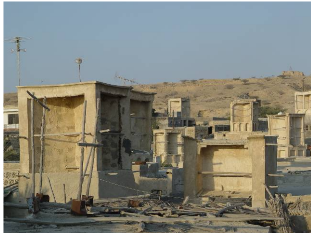
تصاویر شماره ۹: استفاده قابل توجه از مصالح مقاوم کننده سازه در برابر نیروی زلزله مانند چوب در سازه‌های بادگیر بافت روستایی بندر لافت. تاریخ برداشت تصویر: ۱۳۸۰

ایوانهای خارجی رو به دریا می‌نشینند و از جریان بادی که بین دریا و ساحل وجود دارد لذت می‌برند. ایوان در این منطقه از سایر نواحی ایران بزرگتر است و فضای بسیار مهمی در ساختمان محسوب می‌شود. در فصول گرم که مدت آن حدود نیمی از سال است، اغلب فعالیت‌های روزمره در داخل ایوان انجام می‌شود، زیرا در ایوان هم تهویه به خوبی صورت می‌گیرد و هم در زیر سایه قرار دارد. غالباً در دورتادور حیاط مرکزی و همچنین در یک و یا دو سمت خارج بنا، ایوان‌های وسیع و مرتفع وجود دارد (57، 2001، Pirazzoli). خصوصیات کلی فرم بنا در این مناطق به قرار ذیل است: