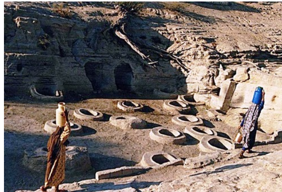
تصویر شماره ۵: چاه‌های تلال، بندر لافت

چاه‌های تلا و آب انبار اصلی روستا جاری می‌شوند. شکل‌گیری بافت در لایه بالایی آن به صورتی است که آب جاری از تپه‌ها، وارد بافت نشود. در روزهای بارانی شدید، در محدوده چاه‌ها دریاچه‌ای تشکیل شده و آب انبار اصلی روستا پر از آب می‌شود. در این ایام این محل به عنوان یک مکان تفریحی در سطح منطقه قشم مورد استفاده قرار می‌گیرد. سرریز آب چاه‌ها و آب انبار از محوطه اطراف مسجد جامع به دریا می‌ریزد. در حال حاضر با امکان انتقال آب از شهر قشم توسط مخزن‌های سیار آب، در حیاط هر واحد مسکونی مخزن آبی در داخل زمین تعبیه شده است (نوربخش، ۱۳۸۰، ۱۴۳).