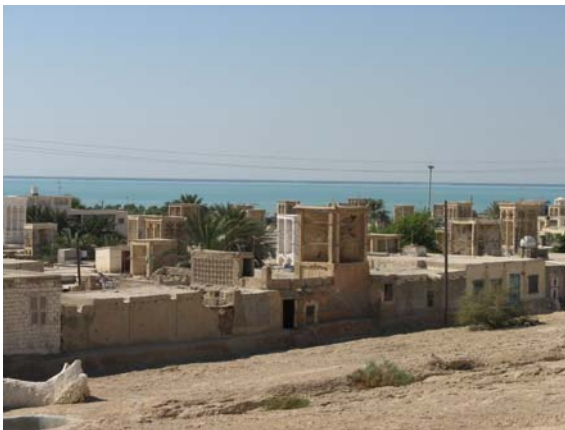
تصویر شماره ۲: سیمای کنونی بندر لافت