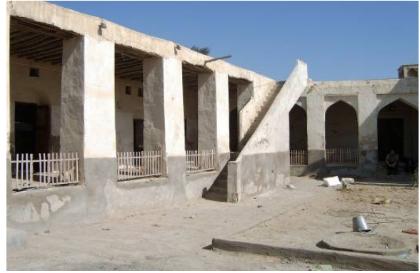
تصاویر شماره ۱۳: تعمیر، نگهداری و مرمت‌های محدود توسط مالکین بومی - تاریخ برداشت تصاویر: ۸۱ - ۱۳۸۰