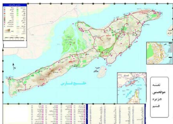
نقشه شماره ۱. موقعیت جزیره قشم.

دشت جزیره دشت توریان در شرق است. خورخمیر در شمال غربی جزیره قشم (خور یا تنگه خوران) واقع گردیده و از جنوب با خور لافت در ارتباط می‌باشد و دربرگیرنده یکی از بزرگترین جوامع گیاهی حرا (مانگرو) در کرانه جنوبی ایران می‌باشد. قشم در دهانه تنگه هرمز است. این جزیره مدخل ورودی خلیج فارس از دریای عمان (تنگه هرمز) قرار دارد. مساحت جزیره ۱۴۹۱ کیلومتر مربع حدود ۲/۵ برابر کشور بحرین است. طول جزیره از بندر قشم تا باسعیدو بین ۱۰۰ تا ۱۳۰ کیلومتر است و عرض آن در شهر قشم ۵ کیلومتر و قسمت باسعیدو تا روستای دوستکو حدود ۱۲ کیلومتر است. به لحاظ تقسیمات کشوری جزیره دارای یک شهرستان دو بخش (قشم و شهاب)، سه شهر (قشم، هرمز، سوزا) و هفت دهستان تقسیم می‌شود. طبق جدول شماره (۱) جمعیت شهرستان قشم در سال ۱۳۸۵ معادل ۱۰۵۳۳۵ نفر بوده و در طول دهه (۱۳۷۵-۱۳۸۵) بطور متوسط سالانه معادل ۳/۷ درصد رشد داشته است. تغییرات جمعیت در سال ۱۳۸۵ نسبت به سال ۱۳۷۵، برابر ۴۴/۳ درصد است. همچنین در سال ۱۳۸۵ از تعداد کل جمعیت شهرستان ۵۸/۶ درصد آن را جمعیت روستایی تشکیل داده است (مرکز آمار ایران، ۱۳۸۵). نقشه شماره (۱) موقعیت جغرافیایی قشم را نشان می‌دهد.