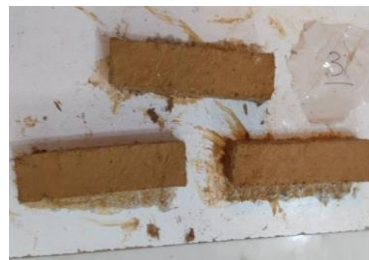
شکل ۱. نمونه‌های خشتی بعد از قالب‌گیری با قالب‌های چوبی با ابعاد 3 \times 10 \times 3 سانتی‌متری

دلیل انتخاب قالب با این ابعاد محدودیت‌های ابعادی فک‌های دستگاه آزمایش بود. پس از قالب‌گیری، نمونه‌ها برای مدت ۱۴ روز در محیط آزمایشگاه و در سایه خشک گردید و سپس مقاومت کششی آن‌ها محاسبه شد. برای سنجش مقاومت کششی نمونه‌های ساخته‌شده از دستگاه آزمون کشش ۲ تنی مدل STM-20 استفاده شد (اشکال ۳ و ۴). این سنجش در آزمایشگاه مواد و مصالح دانشگاه صنعتی کرمانشاه انجام گردید. نمونه‌ها تحت نیروی اعمالی با نرخ ثابت ازدیاد طول 0/6 میلی‌متر بر دقیقه قرار گرفت و مقاومت کششی آن‌ها تا ایجاد گسیختگی اندازه‌گیری شد.