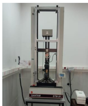
شکل ۳. دستگاه آزمون کشش ۲ تنی مدل STM-20