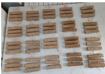
شکل ۲. نمونه‌های خشتی در محیط آزمایشگاه و قبل از انجام آزمون کشش

لازم به ذکر است، پس از الک کردن خاک با الک شماره سه‌هشتم اینچ، ابتدا خاک خشک به میزان ۲۰۰ گرم وزن شده و سپس الیاف پلی‌پروپیلن موجود، مطابق وزن کل خاک خشک، با درصدهای وزنی انتخابی توزین و به صورت خشک با خشت مخلوط شد، سپس آب کم‌کم به مخلوط خاک و الیاف ترکیبی اضافه و مخلوط خشت حاصل شده با دست به مدت زمان معین کاملاً مخلوط گردید تا ملات یکدستی به وجود آید. در این کار سعی شد که سرعت و مدت زمان اختلاط کلیه نمونه‌ها یکسان باشد. بعد از آماده شدن مخلوط گلی، از قالب‌های چوبی با ابعاد 3 \times 10 \times 3 سانتی‌متری برای ایجاد نمونه‌ها استفاده شد (اشکال ۱ و ۲).