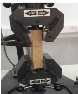
شکل ۴. نمونه‌های خشی در داخل دستگاه آزمون کشش