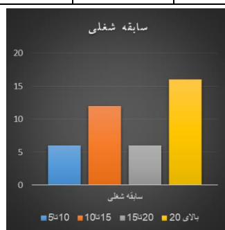
شکل ۳. فراوانی متغیر سابقه شغلی