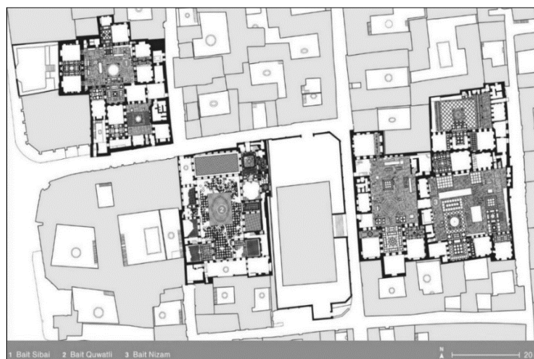
ت ۲. پلان یک محله در دمشق قدیم شامل طبقه همکف بیت سیبایی، بیت قوتلی و بیت نظام