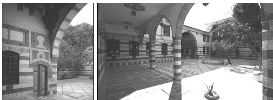
ت ۳. یکی از حیاط‌های خانه نظام قبل از مرمت

مرکبات مانند پرتقال، نارنج و لیمو نیز در محوطه کاشته می‌شود. وجود آب‌نما و حوض برای رطوبت و تعدیل هوا نیز در این خانه‌ها از اهمیت زیادی برخوردار هستند. علاوه بر این، نماهای حیاط مرکزی با الگوها و شکل‌های هندسی پیچیده تزئین می‌شوند (اشعری و قرایی، ۱۳۹۴). خانه با حیاط مرکزی نوعی مسکن پایدار است، زیرا با آب‌وهوا، دوران قدیم و معاصر و فرهنگ‌های مختلف پایداری خود را ثابت کرده است (Edwards et al., 2006) (تصویر شماره ۳).