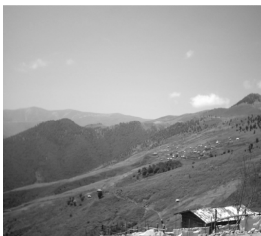
ت ۲. روستای اسبونی در مسیر اسالم به خلخال.

عواملی که باعث فرسایش خاک می‌شوند، عبارتند از: