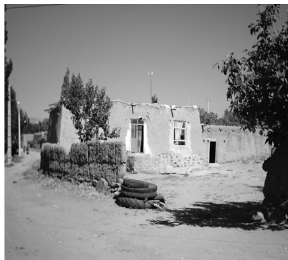
ت ۱. روستای برگ چای در استان اردبیل.

کشاورزی و دامداری در روستاهایی که در مناطق شیب‌دار کوهستانی هستند می‌تواند منجر به فرسایش بیشتر شود.