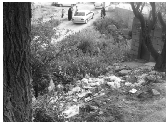
ت ۳. روستای بیله درق در استان اردبیل.

▪ لزوم حفظ کاربری اراضی کشاورزی و جلوگیری از تخریب یا تغییر کاربری اراضی ▪ ضرورت کاهش خسارت های بلایای طبیعی ▪ ضرورت بهسازی و مقاوم سازی ابنیه و مساکن روستایی ▪ فراهم کردن محیط مناسب زندگی در روستاها (رضوانی: ۱۳۸۳: ۱۵۳-۱۵۲) مشکلات دفع زباله نیز از جمله مسایل محیط زیست روستایی است. این مسئله بالاخص در روستاهای توریست پذیر بیشتر نمود دارد. در تصویر شماره ۳ نمونه ای از این مشکلات را می بینیم.