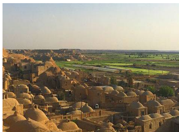
ت 3. نمایی از روستای قلعه‌نو.