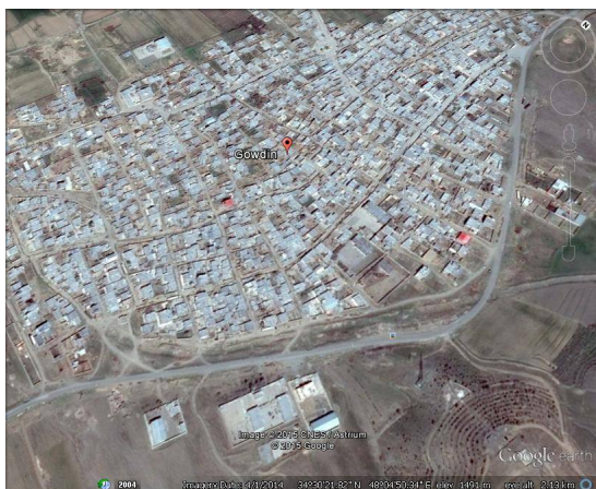
ت 1. نقشه شهرستان گودین.