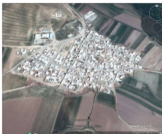
ت 4. نقشه شهرستان دهلر.