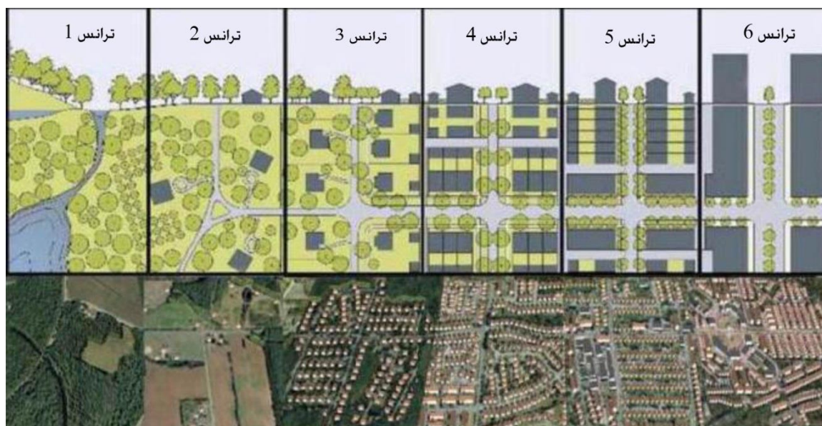
ت ۱. نمایی از ترانس و منطقه‌بندی آن.

روستاها، شهرک‌های اطراف شهر ۱۹ و مرکز شهر را نمایش می‌دهد. سکونتگاه واقع شده در ترانس (۶) از بالاترین درجه ارتباطات اجتماعی، تراکم ساختمانی و انسانی برخوردار است (تصویر شماره ۱).