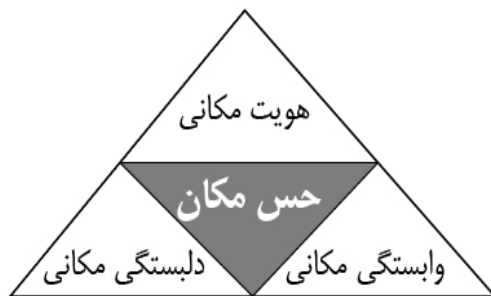
ت. ۱. مدل حس مکان. (Jorgensen & Stedman, 2006)

یورگسن و استدمن ۲۹ مفهوم «حس مکان» را متأثر از چارچوب مفهومی بزرگ‌تری شامل پاسخ‌شناختی، عاطفی و رفتاری ۳۰ افراد نسبت به قرارگاه رفتاری می‌دانند که دارای ابعادی چون هویت مکانی ۳۱ (Proshansky et al., 1983)، دلبستگی مکانی ۳۲ (Altman & Low, 1992) و وابستگی مکانی ۳۳ (Stokols & Shumaker, 1981) است که در تصویر ۱ دیده می‌شود (Jorgensen & Stedman, 2006).