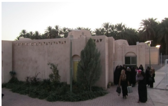
ت ۶. حیات جمعی ساکنان در مجموعه.

تا زمان بیشتری صرف ملاقات یکدیگر، تعامل میان همسایگان و به اشتراک گذاشتن مسائل و مشکلات و یافتن راه حل گروهی می‌شود و در نهایت مشارکت را در ابعاد غیر رسمی در جهت بهبود جامعه محلی ارتقاء می‌دهد و به سلامت، ایمنی و امنیت روانی ساکنان یا افزایش کیفیت زندگی می‌انجامد (Brown & Perkins, 1992).