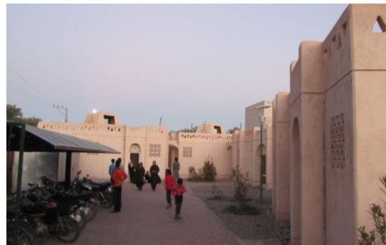
ت ۵. تصویر بازی بچه‌ها در مجموعه (نگارنده).

یکی از مهم‌ترین ویژگی‌های زندگی در مجموعه نرگس برای ساکنان، زمینه‌ای برای حس داشتن مکانی برای خود است تا ساکنان آن مکان را از آن خود بدانند و خود را بر اساس آن مکان معرفی کنند. این مفهوم در ادبیات مکان به هویت مکانی تعبیر می‌شود. هویت مکانی در عین آن که وابسته به فرد، تجارب خاص و نحوه اجتماع پذیری اوست، انعکاس دهنده افراد و گروه‌هایی نیز است که در یک مکان خاص زندگی می‌کنند (proshansky, 1978).