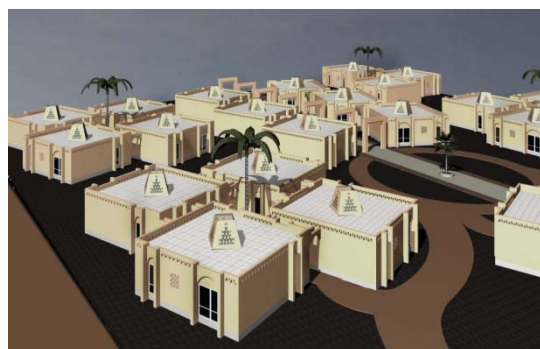
ت ۳. تصویر سه بعدی از مجتمع نرگس (مشاور پدیده خاک)

در حال حاضر ۲۳ خانوار در این مجموعه زندگی می‌کنند که همگی پدر را به‌عنوان سرپرست خانوار از دست داده‌اند. بیش از نیمی از زنان روزها برای کسب درآمد بیرون از خانه مشغولند. اعضای خانواده‌ها بین ۳ تا ۴ نفر می‌باشد و عموماً بچه‌ها بالای ۹ سال سن دارند.