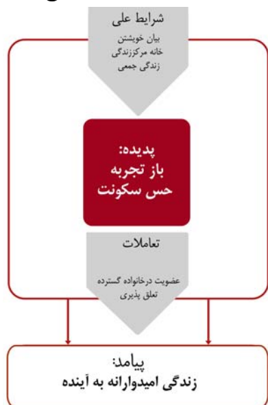
ن ۱. مدل زمینه ای «باز تجربه حس سکونت» در ساکنین مجموعه نرگس بم (نگارنده).

این نظریه و مدل زمینه ای در واقع بازتاب ارزیابی و ادراک مشارکت کنندگان از شرایط زندگی و سکونت در بازسازی مسکونی بعد از زلزله استخراج شده و انعکاس، آن چیزی است که در میدان مطالعه در حال رخ داده بود.