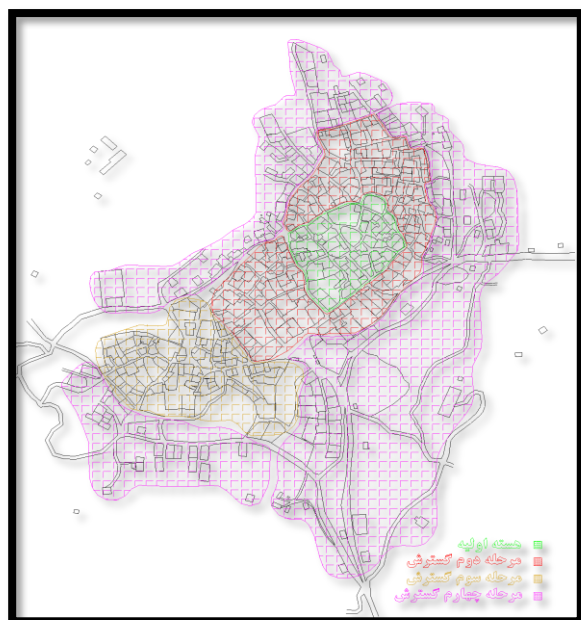
ت ۲. روند رشد فیزیکی روستای شاهکوه سفلی.