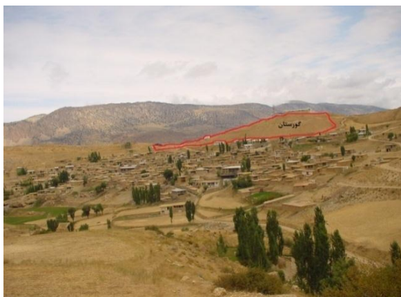
ت ۳. گورستان روستای شاهکوه سفلی.

مکانیابی کاربری‌هایی مانند فضاهای سبز محله‌ای و عمومی روستا به‌ویژه با توجه به نیاز مبرم محله‌های قدیمی به اینگونه فضاها و جلوگیری از تبدیل آن‌ها به مراکز تجمع کود، سوخت، علوفه و ... در محله‌ها ضرورت دارد (حسینی ابری، ۱۳۷۷: ۳۳) و همچنین برای گذران اوقات فراغت روستا و مسافران و بازی کودکان از کارکردهای اجتماعی فضای سبز ضرورت دارد (دربان آستانه، ۱۳۸۷: ۲۸). به‌صورت کلی بافت اولیه روستای مورد مطالعه در شیب بسیار مناسب قرار گرفته است و به این دلیل مشکل خاصی از نظر دفع فاضلاب و شکل‌گیری مانداب‌ها در کوچه‌ها وجود ندارد. از طرفی گورستان چسبیده به روستا در قسمت شرقی و مسلط بر آن مکانیابی شده است و در طول قرن‌ها به‌همین وضعیت گسترش یافته که سبب نارضایتی ساکنان شده است که البته زیباسازی گورستان فعلی نیز بسیار مهم است. احداث فضای سبز علاوه بر ابعاد روانی، در حفظ محیط زیست و زیبایی شناسی محیط نیز می‌تواند مفید باشد (مطیعی لنگرودی: ۱۳۸۳، ۱۰۴).