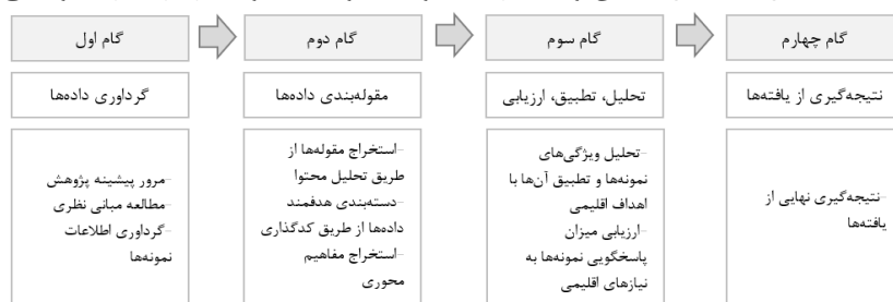
شکل ۳. مراحل گام‌به‌گام پژوهش

گام چهارم: نتیجه‌گیری شامل بحث و نتیجه‌گیری از یافته‌ها در این مرحله یافته‌های حاصل از تحلیل اقلیمی و عملکردی نمونه‌ها موردبحث و آنالیز قرار گرفته و نتایج نهایی حاصل شد.