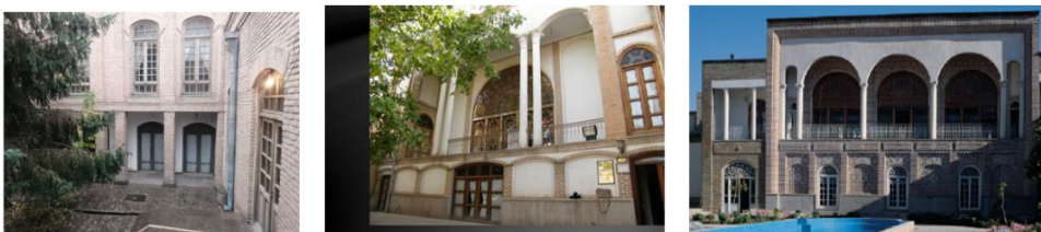
شکل ۸. به ترتیب از راست: خانه‌های قدکی، حیدرزاده و شربت‌اوغلی

برخی از نمونه‌های بررسی‌شده با جهت‌گیری شمالی و بدون دریافت تابش، یا با جهت‌گیری شمال غربی، شمال شرقی و شرقی با دریافت تابش کم وجود دارند که به‌عنوان فضاهای نیمه‌باز تابستان‌نشین در فصل گرم کارایی بهتری دارند. نمونه‌هایی از آن در شکل ۸ دیده می‌شوند.