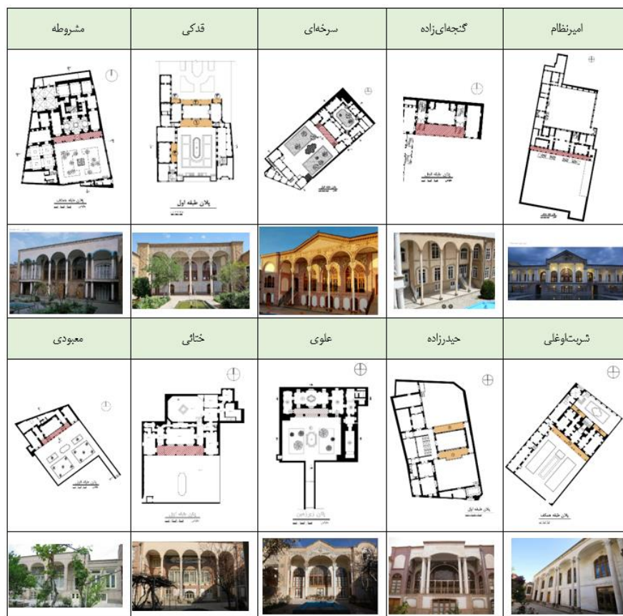
شکل ۴. نمونه‌های بررسی‌شده از خانه‌های قاجاری تبریز