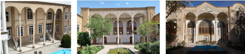
شکل ۷. به ترتیب از راست: خانه‌های علوی، قدکی، گنج‌ای زاده

*الگوی ۱: بسته → نیمه‌باز → باز، الگوی ۲: نیمه‌باز → بسته → باز