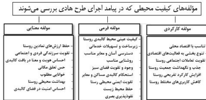
شکل ۱. مؤلفه‌های مورد سنجش کیفیت محیطی به واسطه اثرپذیری از اجرای طرح‌های هادی روستایی

از آنجا که حس‌هایی غیر از حس بینایی هم در درک محیط نقش دارند؛ جریان هوا، اکوستیک، دمای پیرامونی و بو، همه این‌ها بر تجربه ما از فضا تاثیرگذارند (Salem et al., 2019). ضروری است تا در بررسی کیفیت محیط مورد توجه قرار گیرند. بدین منظور ادراکات حواس پنجگانه به تفصیلی که در جدول ۱ آمده مورد بررسی قرار گرفته است.