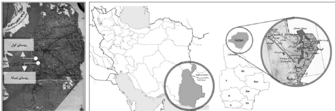
ت ۱. موقعیت منطقه و روستاهای مورد مطالعه

بستر مورد مطالعه در منطقه سیستان در شمال استان سیستان و بلوچستان بوده که همواره در معرض وزش