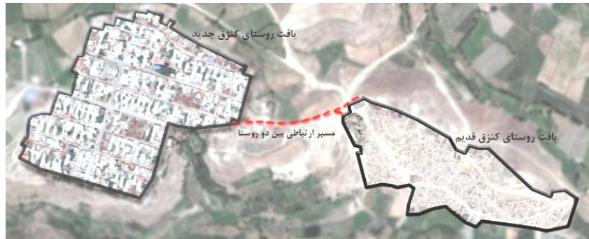
ت 1. پلان کلی بافت در روستای کنزق قدیم و جدید.