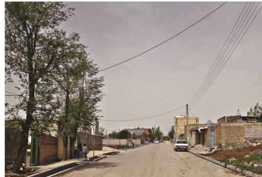
ت 2. بافت پلکانی و بافت شبکه‌ای روستای کنزق قدیم و جدید.